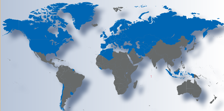
Partes contratantes TIR en 2011

El número de Cuadernos TIR emitidos cada año no cesa de crecer en el transcurso de los años. Teniendo en cuenta el incremento previsto de los volúmenes comercializados a nivel internacional, el Régimen TIR está destinado a jugar un papel cada vez más crucial en materia de promoción, de seguridad y facilitación del comercio y del transporte internacional por carretera.