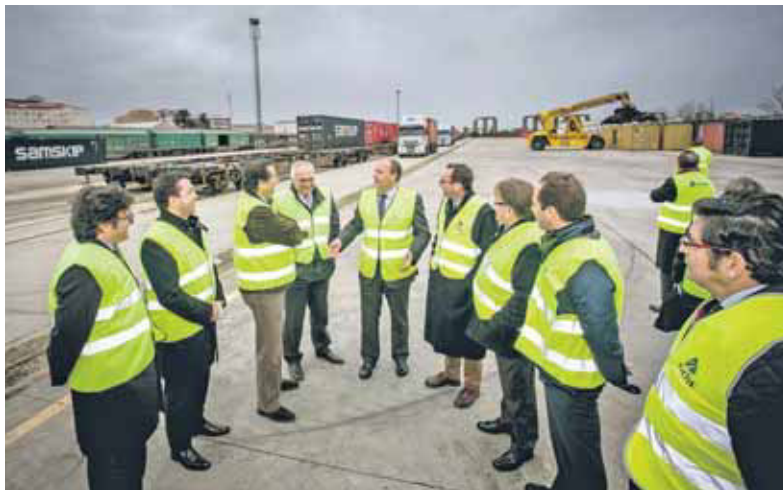
IMAGEN de archivo de la inauguración del centro logístico San Lázaro de Mérida en 2014.

La actividad de la instalación, que se retomó en febrero de 2014, tras permanecer tres años inactiva, quedó suspendida en noviembre de 2015 ante la escasez de tráfico que se registraban y los intentos para reflotarla a lo largo del presente año no han cuajado. Entre esos intentos, los promotores del proyecto trataron de atraer a algún socio industrial, que aportase cargas a la terminal, aunque sin éxito.