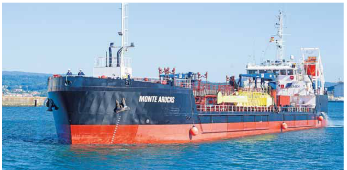
CEPSA suministra combustibles tradicionales en puertos.

La iniciativa se inscribe dentro del programa 'Core LNGas Hive', seleccionado por la Comisión Europea, cuyo objetivo es desarrollar una cadena logística de GNL que permita impulsar la utilización del gas como un combustible para el transporte, especialmente el marítimo. Liderado por Puertos del Estado y coordinado por Enagás, la iniciativa europea cuenta con 42 socios de España y Portugal.