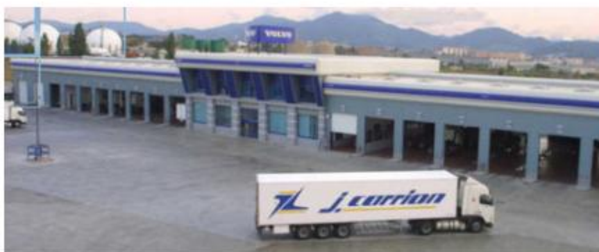
Transportes J. Carrión separa concesionario y empresa de transporte.